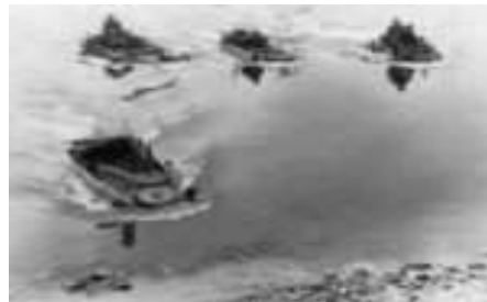
Slika 2 – „Folkswagenovo“ ploveće vozilo Figure 2 – VW-Schwimmwagen amphibious vehicle