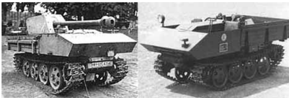
Slika 3 – Nemački amfibijski transporteri za vreme Drugog svetskog rata Figure 3 – German's amphibious transporters used during World War II

Pripremajući se za vođenje „blickriga“ (munjevitog rata), Nemačka je, u okviru priprema za buduću ekspanziju, u naoružanje uvela čitavu paletu novih sredstava za savlađivanje vodenih prepreka, od pneumat-skih i jurišnih čamaca, preko amfibijskih transportera do tenkova nosača mosta i prvih plovećih tenkova. Izgled plovećih transportera iz tog vreme-na prikazan je na slici 3. Tokom Drugog svetskog rata, suočene sa veli-kim problemima pri savlađivanju vodenih prepreka, sukobljene snage ra-de na modernizaciji postojećih sredstava, naročito amfibija i kompleta mostova na pontonima. U tom periodu Velika Britanija razvila je i uvela u upotrebu lansirni most tipa „Bejli“. Suočeni sa problemom savlađivanja velikih rečnih tokova u SSSR-u, snage Vermahta su, takođe, veliki značaj pridavale osavremenjivanju i razvoju pontonskih mostova. Od kompleta mosta nosivosti od 3 do 5 t, sa početka rata, već 1943. godine u naoru-žanje su uvedeni kompleti mosta čija je nosivost omogućavala uspešno prebacivanje preko vodenih prepreka gotovo svih sredstava vojne tehni-ke (Milojević, 2010. p.125).