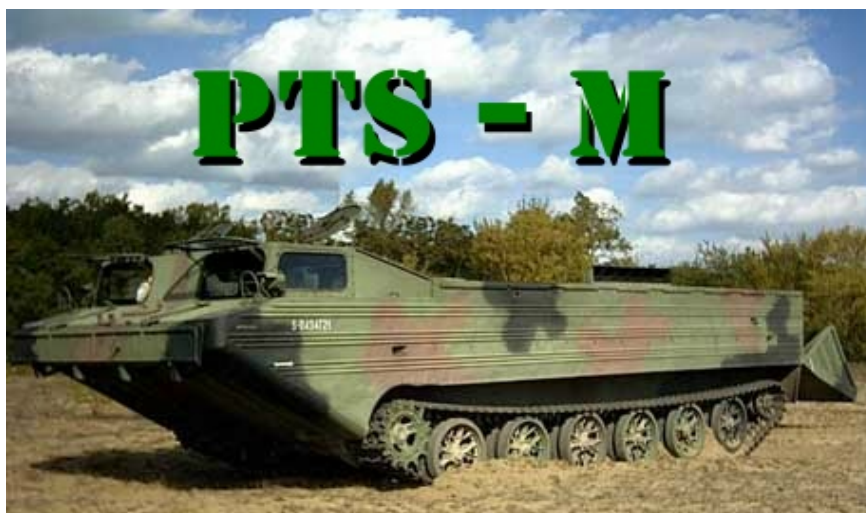
Slika 5 – Izgled amfibijskog transportera PTS-M Figure 5 – Amphibious transporter STM - M

Od 2003. godine amfibijski transporter je delimično rashodovan, to jest iz njegovog kompleta je izbačena plivajuća prikolica, čime su sposobnosti transportera znatno umanjene. Ipak, i kao takav danas zapravo predstavlja jedino amfibijsko sredstvo u Vojsci Srbije. Izgled amfibijskog transportera PTS-M prikazan je na slici 5.