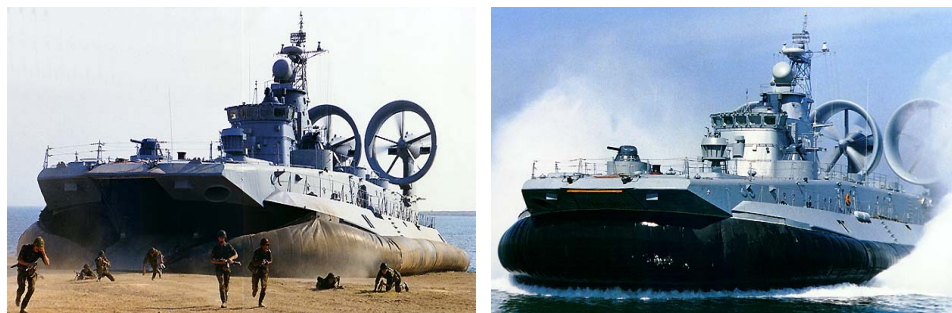
Slika 4 – Izgled lebdelice Figure 4 – Howercraft

Ipak, iako su se pokazala kao veoma efikasna i pouzdana, savremena vojna industrija najrazvijenijih zemalja današnjice planira da u narednih 20 do 30 godina delimično ili čak u potpunosti izbaci iz operativne upotrebe amfibijska sredstva i da njihovo mesto zauzmu lebdelice. Lebdelice su sredstva najnovije tehnologije ( http://www.naval-technology.com/projects/zubr ) koje su našle široku primenu pri savlađivanju vodenih prepreka. Pojavile su se još sedamdesetih godina u ratu u jugoistočnoj Aziji. Osnovni problem prvih lebdelica bio je što su bile vrlo spore i imale su mogućnost male nosivosti naspram velike sopstvene mase. Tada su se koristile samo u obalnom delu mora i u slivovima velikih reka. Osnovni princip po kojem rade je kretanje na vazдушnom jastuku. Prikaz osnovnih modela lebdelica dat je na slici 4.