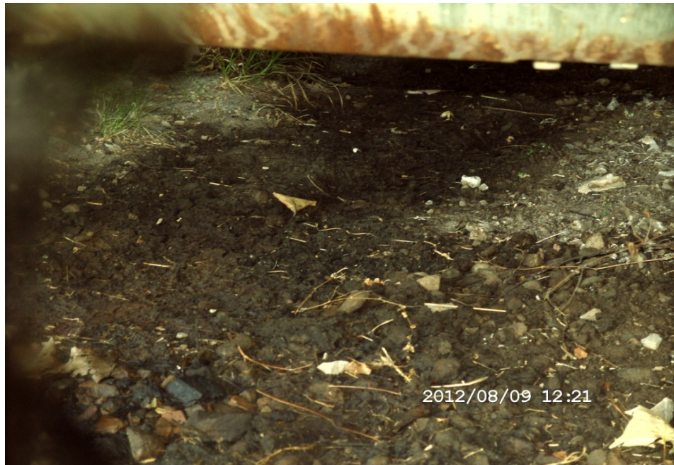
Slika 6 – Izgled zemljišta na stajanci Figure 6 – Ground of a transporter parking area

Da bi se otklonio negativan uticaj transportera na zemljište prilikom boravka na stajanci, bilo je neophodno postaviti posebne posude za prikupljanje otpadne materije ispod ispusnih otvora. Ovim prostim rešenjem sprečilo se izlivanje otpadnih materija direktno na tlo, a i naknadnim posebnim tehnološkim procesima prerade naftnih derivata mogla bi se preraditi prikupljena količina otpadnih materija.