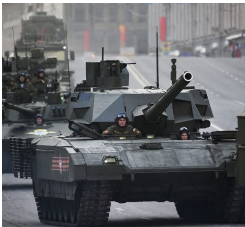
Русија је приказала први пут у јавности тенк нове генерације „армата Т-14”

Тенк „армата” прво је оклопно борбено возило које има унутрашњу „капсулу” у којој је смештена трочлана посада и куполу на даљинско управљање са аутоматским системом пуњења оружја. Наоружан је топом који има цев калибра 125 мм, а може да испали гранате и ракете са навођењем. Заштита посаде много је боља него код постојећих тенкова, која је смештена у ојачаној кабини, даље од главне цеви. Наглашено је да тај тенк може да буде унапређен у „потпуно функционално роботско борбено возило”. Његова компјутерска технологија, брзина и способност маневрисања, супериорнији су од тенка Т-90. Штампана је нагласила да је тенк „армата” испред западне конкуренције, те да Министарство одбране планира да уведе 2.300 тенкова тог модела у наоружање оклопних јединица од 2020. године, који би заменили тенкове из совјетске ере.