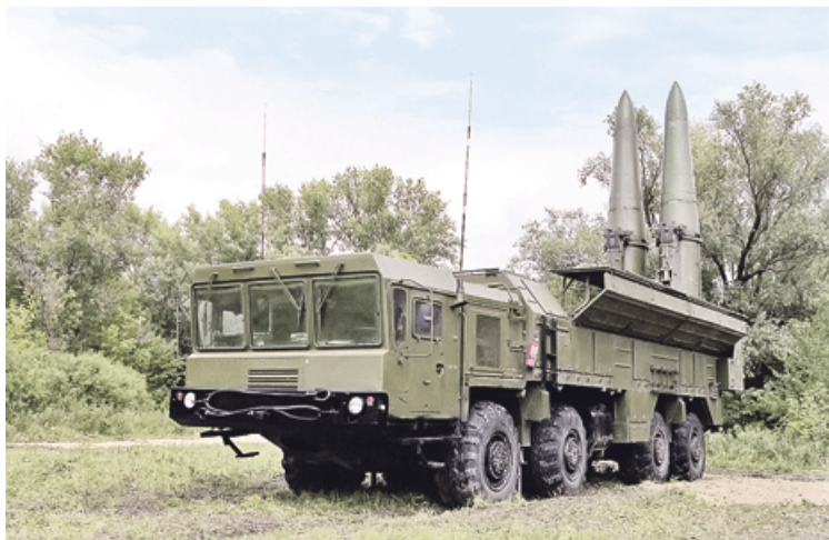
Ракетни систем „искандер”