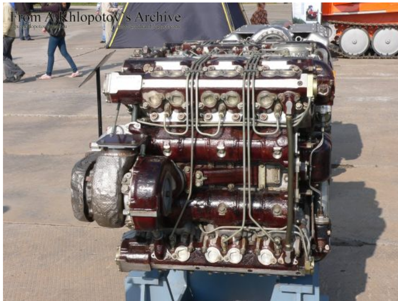
Клипни четворотактни 12-цилиндрични турбо-дизел мотор 85-3А тенка „армата”

Тенк, односно носећу платформу система „армата”, покреће клипни четворотактни 12-цилиндрични турбо-дизел мотор 85-3А (понекад се назива 2А12-3, 12ЦХН15 / 16 или 12Н360) од 1.200 КС (Дизельный четырехтактный, Х – образный, 12 –цилиндровый двигатель 12Н360). Маса мотора је 5 тона, а његов животни век је најмање 2000 часова. Постоје варијанте да се угради и мотор од 1500 КС, што би знатно повећало животни век тенка. Мотор је произведен још 2011. године, у погонима фабрике „Трансдизел” у Чельабинску, када је и тестиран. Хлади се ваздухом 38 .