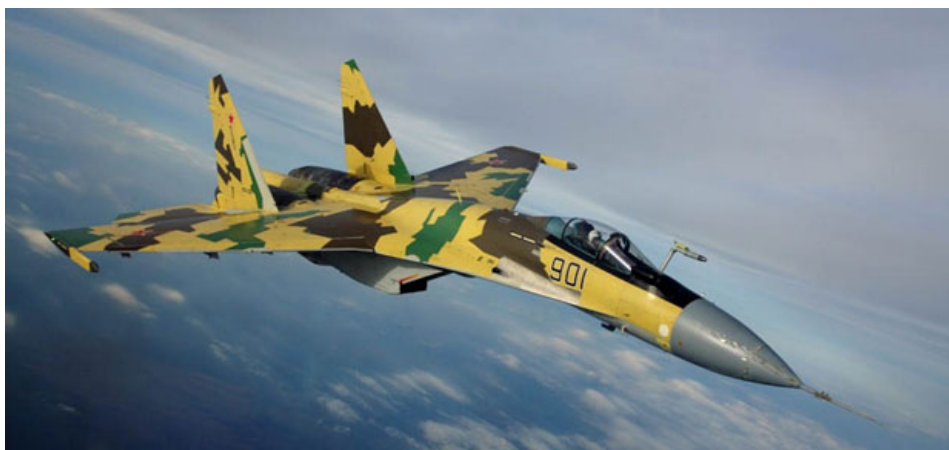
Руски невидљиви борбени авион, ловац пете генерације Т-50

Изнад Црвеног трга је, 9. маја, на висини од 200 метара, прелетело 140 типова авиона и других борбених и неборбених летелица. Из безбедносних разлога није представљен руски невидљиви војни авион, ловац пете генерације Т-50, пошто још нису завршена сва испитивања и није предат на коришћење оружаним снагама.