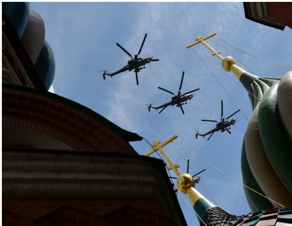
Хеликоптер Ми-28Н „ноћни ловац” у парадној формацији