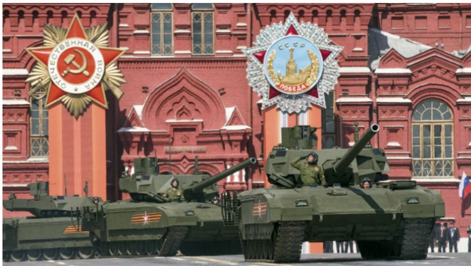
Сензори на тенку „армата“ пружају „хемисферичну“ покривеност, откривајући пројектиле пре него што уђу у зону где могу изазвати разарајуће последице

Купола топа има карактеристичан облик испресецаних панела постављених под различитим угловима ради одбијања пројектила противтенковских оруђа и калибара.