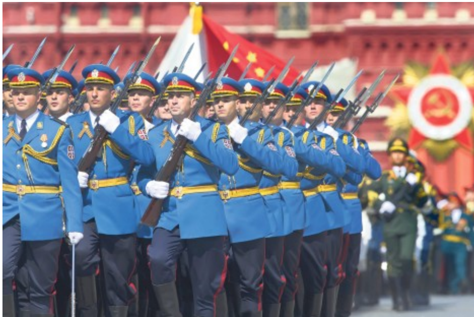
Гардисти Војске Србије на паради у Москви

слободна територија. Антифашистичке јединице НОВЈ и јединице Југословенске војске у отаџбини, под командом генерала Драже Михаиловића, бориле су се против окупатора и квислинга без директног ослоња на војне снаге и фронтове које су држали СССР, Велика Британија и САД. Рат на нашим просторима започет је са потпуно неравноправним односом снага у живој сили и у техници. За слом фашизма и нацизма српски народ поднео је огромне жртве, дајући са своја два антифашистичка покрета (комунистичким и монархистичким), пуни допринос савезничкој победи над фашизмом у Другом светском рату. У том смислу, председник Руске Федерације Владимир Путин је у свом говору на паради, захваливши свим земљама које су се против Сила осовине херојски бориле у Другом светском рату, посебно истакао „храбар и херојски отпор Срба“, најавивши како ће Црвеним тргом, поред других страних ешелона, промарширати и Војска Србије.