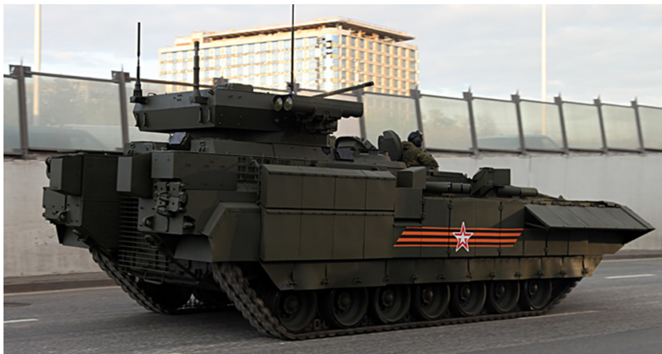
Оклопни борбени транспортер Т-15

На предњој страни налази се топ 125 мм глатког канала, без спрегнутог оружја (иако је у претходној варијанти из 2013. године био уграђен спрегнут топ 30 мм и митраљез 7,62 мм). Топ је другачији од претходних модела који се користе на Т-90 и Т-72. Главна разлика је одсуство евакуатора (одвојен је од простора за посаду тако да није потребно извлачење гасова сагоревања из топа и то не представља проблем за безбедност посаде). На куполу ће се вероватно моћи поставити неки аутоматизовани (роботизовани) оружни систем, као и уређаји за мерење елемената за израчунавање балистичких података. Ту су и системи за праћење метеоролошке ситуације, на задњем делу код Т-15 и на куполи Т-14, којима се прикупљају и други подаци за балистички рачунар.