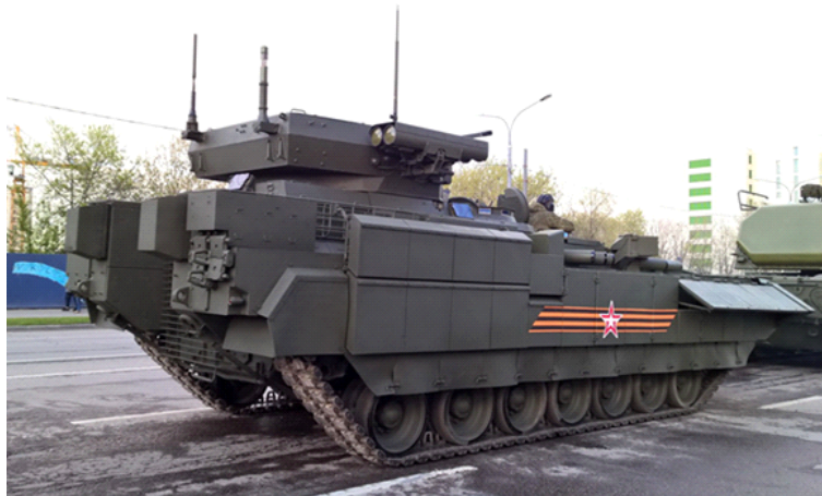
Борбено возило „курганец-25”

Мотор са доводом ваздуха за хлађење и издувни делови захтевају посебне адаптације оклопа.