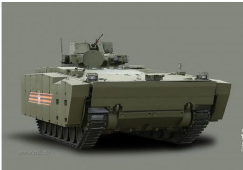
Борбено возило пешадије „курганец“ на шасији тенка Т-14 „армата“

Joш пре него што је светска јавност сазнала за нови руски тенк, нагађало се о његовим особинама, концепцији и борбеним могућностима. „Армата” је, као изазов за аналитичаре окупирао многе водеће часописе о наоружању и војној опреми. Коришћени су бројни извори да се дође до конкретних података, при чему су и обавештајци били ангажовани да прикупе чињенице како би се сагледале његове борбене и маневарске могућности и проценило колико се тај тенк разликује од нових западних модела. Тако је часопис „Defence Update” објавио прелиминарну анализу новог руског тенка „армата”, као и борбеног возила „курганец” са истом возном платформом, сачињеном на основу прикупљених фотографија пре 9. маја 2015. године 34 .