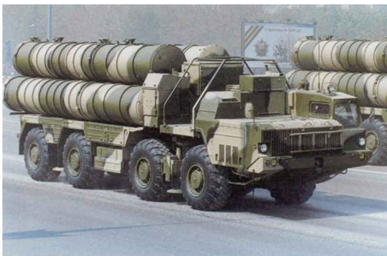
Противракетни систем новије генерације С-400 „тријумф”

Црвеним тргом прошли су затим ешалони савременог наоружања. Приказана су нова оклопна возила „тигар”, у основној верзији, са шасијом „армата”, опремљени најсавременијом опремом за противтенковску борбу, као и оклопни транспортери БТР-82А, тенкови Т-90А и самоходне хаубице „МСТА-С”. У ешалону су се налазила и борбена средства за противваздушну заштиту јединица у захвату фронта, међу којима и зенитни ракетни системи „бук-М22”, зенитни ракетно-топовски системи „панцир-С1”, „С-400” и интерконтинентални ракетни системи „јарс”.