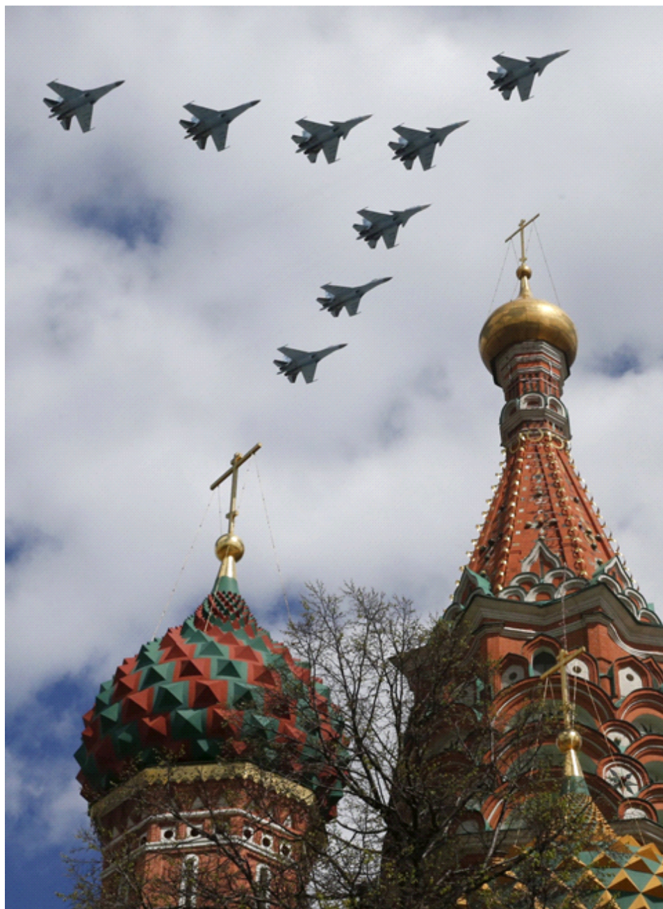
Ваздухопловни ешалон над куполама цркве Св. Василија на Црвеном тргу