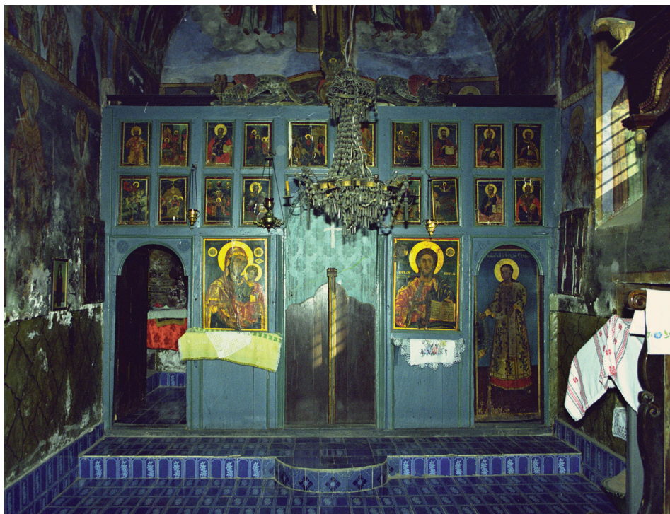
Слика 1. Иконостас у цркви Светог Димитрија у Добротину

су традиционалност, поетика ретроспективности, коришћење устаљених иконографских образаца, злата и флоралних мотива (Макуљевић, 2003; Макуљевић, 2005, стр. 21–25).