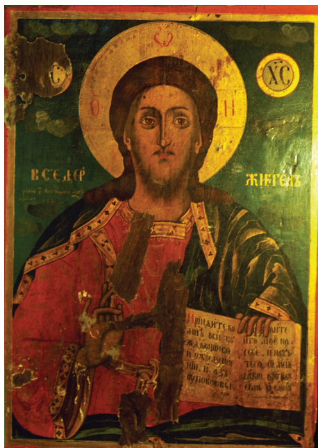
Слика 2. Исус Христос Сведржитељ (Покрајински завод за заштиту споменика културе, Приштина)

Јужно од царских двери је икона Исуса Христа Сведржитеља (ѿ хс вседержитељ), који је насликан фронтално и допојасно, спрам плаве позадине са облацима. Стандардне физиономије, Христос је одевен у црвени хитон са златним појасом и плавим химатионом, који су оперважени златним порубима. Док на златном нимбу има иницијале ѿ ѿ њ, и благосиља десном руком, у левој руци држи отворену књигу. У њој су исписани стихови из Јеванђеља по Матеју „Приндите ко / мнѣ всѣ трѣ / ждѣющіи са / њ ѿбременѣн / нѣн, њ ѡзъ / оупокѡю вы. / возмѣте / возмѣте / њго мѡѣ на / себѣ, њ навѣн / те са ѿ мене / ѡко крѡтокъ / есмѣ њ смрѣнъ / сѣрдцемъ: н ѡбръщете” (Мт. 11, 28–29). 6 На овој икони налази се потпис сликара, исписан златним словима испод дела Христовог епитета вседер: „рѡкѡю · хс · Костандѣнъ Зографъ / њъ велесѣ. 1862”. 7