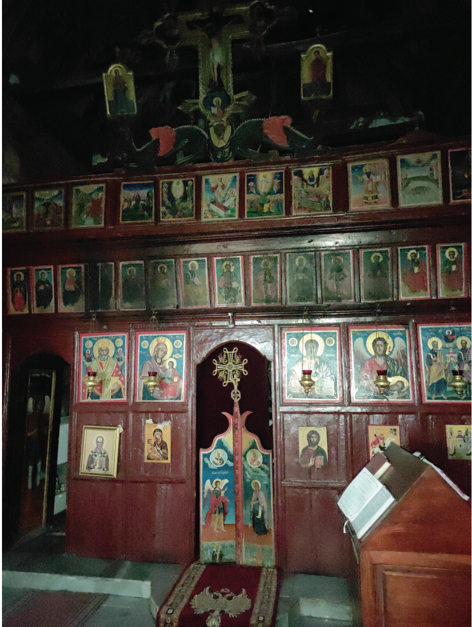
Слика 7. Иконостас у Цркви Светог Николе у Косовској Каменици (Зоран Вујић)