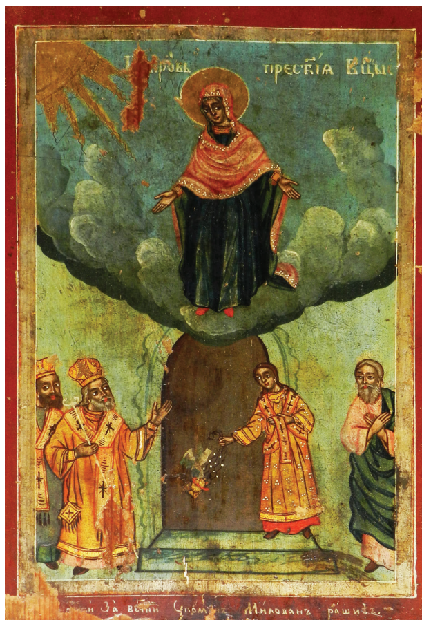
Слика 4. Покров Пресвете Богородице (Аутор)

по двадесет мученичких венаца. 11 Свети Лука је насликан са проређеном смеђом косом и брадом, у плавом хитону и ружичастом химатиону. Длан десне руке држи на грудима, а у левој држи Јеванђеље са текстом „Понеже / оубѡ днѡ / зн начаша / чинити / повѣстѣ / ѿ / ѿз вѣ- / ствован- / ныхъ вѣ / насъ ве / щѣхъ. / може” (Лк. 1, 1–2). Свети Никола има груграву седу браду и нешто дужу косу покупљену на потиљку. Одевен је у архијерејски орнат, који чине плави стихар, црвени фелон, сиви епитрахил и златни надбедреник. На грудима има крст, а у левој руци затворену књигу.