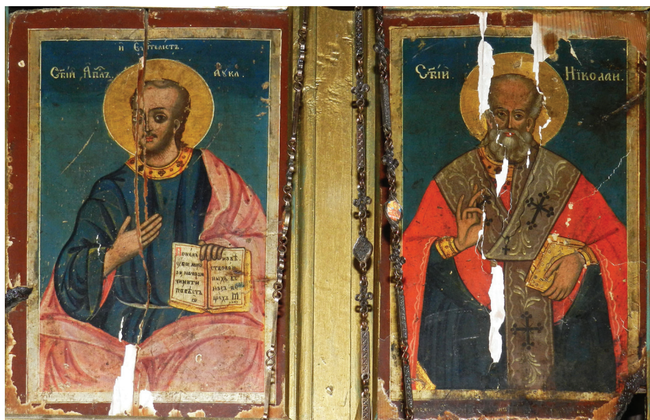
Слика 3. Свети Лука и Свети Никола (Аутор)