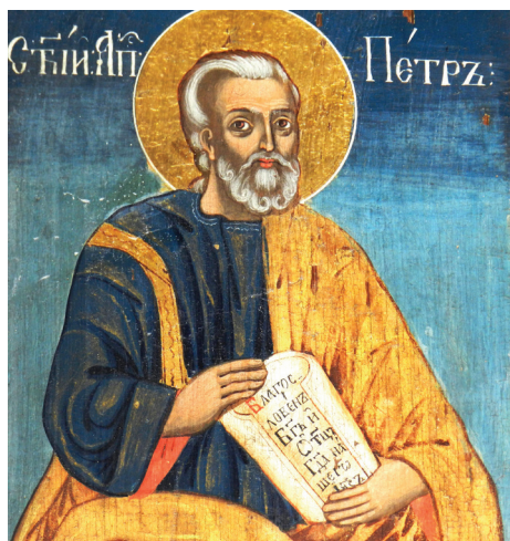
Слика 10. Свети апостол Петар (Аутор)

су спрам двобојне позадине која симболише пејзаж – доњи део је зелене, а горњи део је плаве боје. Све иконе имају сребрни и црвени сликани оквир. Сликара је водио рачуна о симетрији када је сликао и распоређивао иконе у овој зони, имајући у виду захтев приложника да се ту смести и Света Петка, али имајући у виду и традиционални распоред апостолских икона у складу са литургијским распоредом. Према њему, Христос се поставља у средину, око њега су Свети Петар и Павле, њих потом фланкирају по две фигуре јеванђелиста, и око њих су преостали апостоли. 24 Сликара је водио рачуна о симетрији и у погледу тога на коју