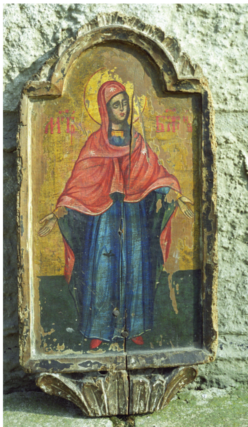
Слика 5. Богородица, део монументалног сликаног Распећа (Покрајински завод за заштиту споменика културе, Приштина)