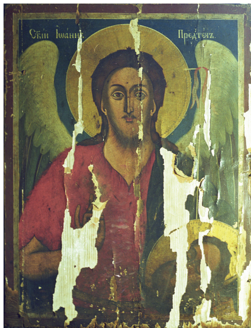
Слика 6. Свети Јован Претеча (Покрајински завод за заштиту споменика културе, Приштина)

/ прорѣцѣхъ / се ѡзъ / посылаю / ѡтѣ гла мо / егѣ прѣд / лицѣмъ / твоимъ, ѡ / же оуѣгото” (Мк. 1, 1–2). На самом крају реда налазе се иконе Светих апостола Петра и Павла, уобичајених физиономија. Прва је икона Светог апостола Павла у зеленом хитону и ружичастом химатиону, са десном руком на грудима и затвореном књигом у левој руци. Свети апостол Петар је у зеленом хитону и ружичастом химатиону, са десном руком на грудима и затвореном књигом у левој руци.