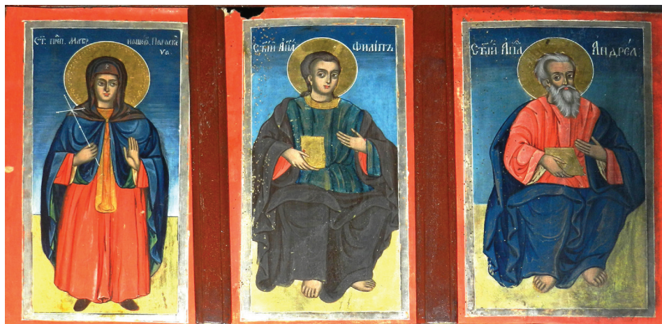
Слика 9. Света Петка, Свети Филип и Андреј (Аутор)

левој, и Богородицом (Мѣр Бжѣа), на десној страни, заузимају централну позицију. Из отвореног неба ка Богородици се спушта голуб Светог Духа. У односу на двери у Великом Ропотову, архангел у Косовској Каменици има мање детаља на одећи и телом је више окренут ка Богородици коју такође благосиља једном руком док у другој држи цвеће. Богородичина глава је мало погнутија, а одежда је нешто сведенија. 23