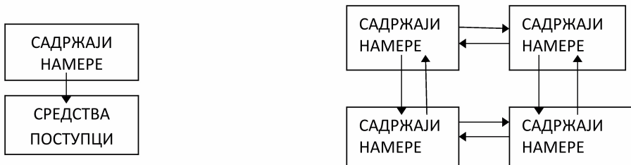
ШЕМА 1: ЗАВИСНОСТ И МЕЋУЗАВИСНОСТ САДРЖАЈА, МЕТОДА, ПОСТУПАКА И СРЕДСТАВА, ПРЕМА КЛАФКИЈЕВОЈ ТЕОРИЈИ (ВИЛОТИЈЕВИЋ, 1999, СТР. 58)

ступци и средства у стању зависности ( гејенденције , dependence). По Клафкијевом концепту, прво се одлучује шта треба учити и зашто , па тек онда, зависно од тога одлучује се како и чиме учити. Дакле, постоје две области: а) циљеви и садржаји и б) сам процес наставе. Одлуке о било којој од њих могу се у време припреме (процес рефлексije) кориговати. Друга област (поступци и средства) не утичу на прву (циљеви и садржаји).